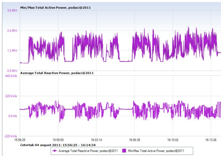
Slika 2: Aktivna i reaktivna snaga rotorskih bagera sa uključenom kompenzacijom

Iz prikazanih režima rada očigledno je da dinamička kompenzacija reaktivne snage vrši projektovanu funkciju i velike oscilacije reaktivne snage motora bagera svodi na minimalnu moguću meru. Energetski transformator je rasterećen, a padovi napona su minimizirani. Uspešna kompenzacija reaktivne snage brzopromenljivih opterećenja moguća je samo sa opremom dinamičkog tipa.